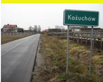
Modernizacje dróg powiatowych: Białobrzegi - Mikówka, Przytyk - Kozuchów, Kadłub - Stara Błotnica, Turno - Brzeźce, Tomczyce - Grzmiąca, Radzanów - Podlesie. Wartość zadań 1.202.983 zł