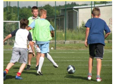
We wrześniu na boiskach Orlik odbył się turniej o Puchar Premiera Donalda Tuska. W zawodach wzięło udział ponad 200 uczniów szkół podstawowych i gimnazjalnych.