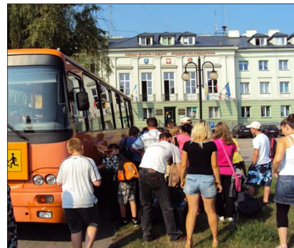
Dla wielu dzieci był to pierwszy wyjazd na wakacje.