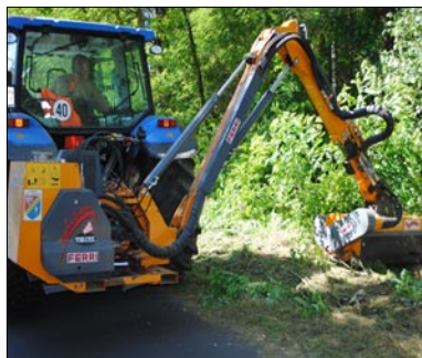
Nowe urządzenie w czasie pracy.

Ciągnik pracuje na drogach powiatowych i gminnych.