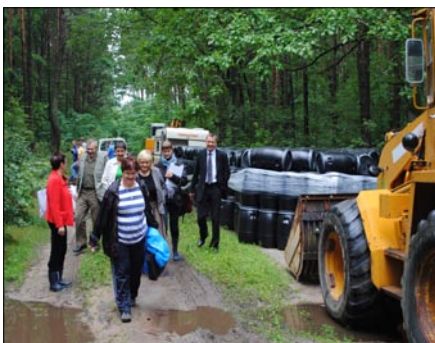
Prace przy likwidacji składowiska już trwają.

Firma SAVA rozpoczęła likwidację mogilnika w Dobieszynie jako pierwszego obiektu z terenu województwa mazowieckiego. Działła na podstawie decyzji wydanej przez Starostę Białobrzeskiego w dniu 22.07.2010r.