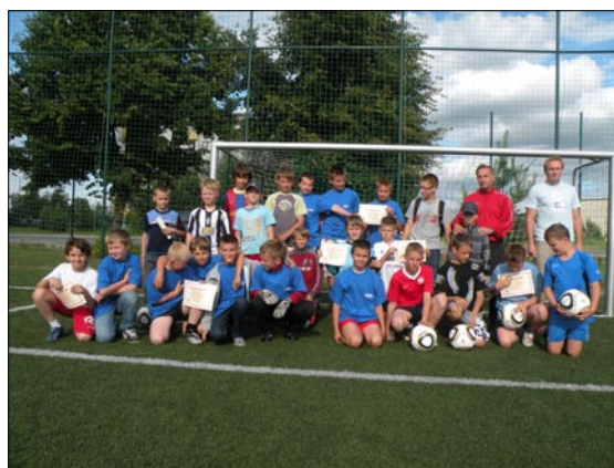
Uczestnicy turnieju z nagrodami.

W zawodach wzięło udział 35 chłopców ze szkół podstawowych z Białobrzegów i okolic.