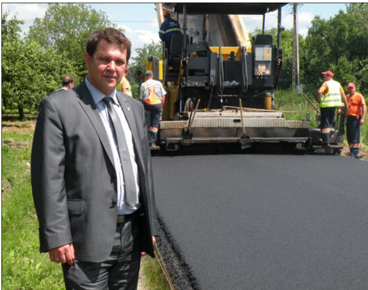
Kończą się prace na drodze.

Przypominamy, w styczniu podpisana została umowa na dofinansowanie tego zadania. Starostwo powiatowe pozyskało 4,4 mln na sfinansowanie inwestycji, której wartość oszacowano na ponad 5,4 mln zł. W wyniku przeprowadzonej procedury przetargowej ostateczna wartość wykonania prac wyceniona została na 3.666.808,47 zł. 300 tys. zł z tej kwoty dofinansował