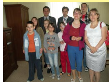
Uczniowie ze szkoły specjalnej w Radomiu wraz z opiekunami gościli u starosty. Mieli możliwość m. in. zwiedzenia gabinetu starosty.