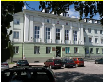
Termomodernizacja budynku Starostwa wraz z budową parkingów. Wartość 338.287 zł.