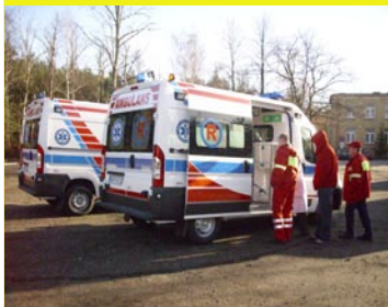
Zakup dwóch ambulansów dla SP ZOZ. Wartość zadania 660.000 zł.