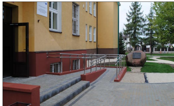
Odnowiony plac przed szkołą z podjazdem dla niepełnosprawnych.

Częściowo zachowany również został obecny układ chodników dla pieszych oraz dodatkowo zostały wykonane