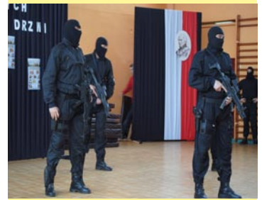
W ZSP odbył się wyjątkowy „dzień otwarty”. Gościliśmy m. in. grupę antyterrorystyczną z Warszawy.