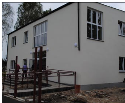
Rozbudowa DPS-u trwa.

W ramach prac obecnie realizowanych wykonywany jest generalny remont głównego budynku. Będzie on mieścił jadalnię, świetlicę, bibliotekę i salę doświadczania świata dla dzieci głęboko