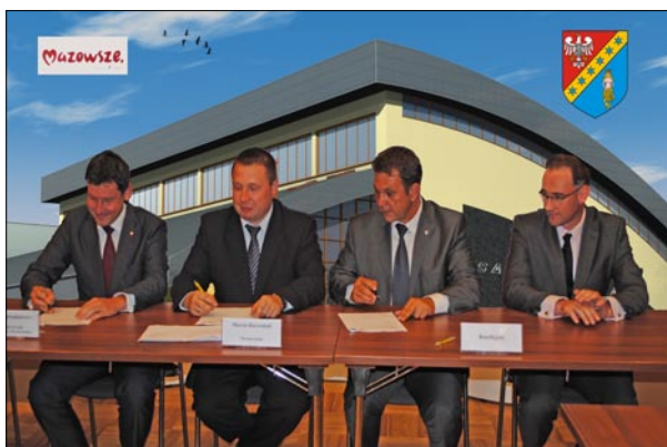
Podpisanie umowy na dofinansowanie budowy hali w Urzędzie Marszałkowskim w Warszawie.

W rozwiązaniach technicznych zastosowano również system solarny oświetlenia budynku. Na dachu gimnazjum umieszczone zostaną baterie słoneczne, które dostarczą energię na nocne oświetlenie zewnętrzne hali.