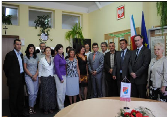
Podpisanie umowy w obecności nauczycieli liceum z wykonawcą firmą DORBUD.

tenisa ziemnego. Na południowej ścianie usytuowana zostanie ścianka wspinaczkowa o różnej trudności. Całość areny głównej będzie można podzielić kotarami na trzy niezależne place o wymiarach boisk do koszykówki. Ciekawostką jest fakt, że na piętrze hali zaplanowano budowę 40m bieżni tartanowej.