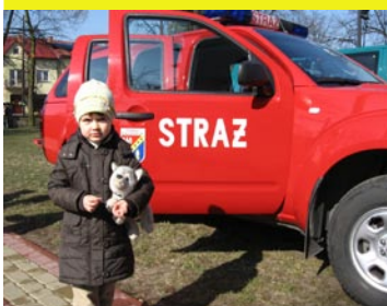
Zakup samochodu rozpoznawczo-gaśniczego dla Komendy Powiatowej Państwowej Straży Pożarnej. Wartość 137.000 zł.