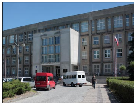
Wojskowa Akademia Techniczna w Warszawie.

przez siebie specjalności na uczelni patronackiej. Będą mogli, podobnie jak i wszyscy uczniowie naszej Szkoły, poznać bliżej, gdyż Wojskowa Akademia Techniczna - najlepsza wojskowa uczelnia w kraju - zobowiązała się do objęcia patronatem naukowym