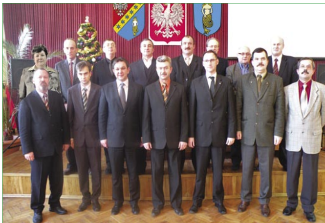
Rada Powiatu III kadencji

W czerwcu odbyły się również posiedzenia komisji: Infrastruktury, Rolnictwa, Leśnictwa i Ochrony Środowiska, którego tematem było zapoznanie się z planem modernizacji i naprawy dróg powiatowych; Promocji, Edukacji, Zdrowia i Spraw Społecznych, która obradowała w sprawie kalendarza imprez kulturalnych i sportowych.