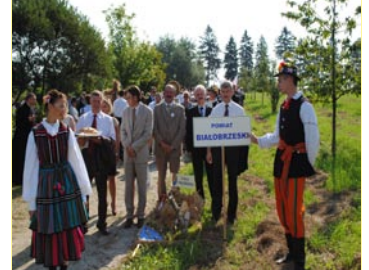
Delegacja Rady Powiatu i Starostwa uczestniczyła w Dożynkach woj. mazowieckiego w Sierpcu. Wieniec dożynkowy przygotowały Warszaty Terapii Zajęciowej z Olszyny.