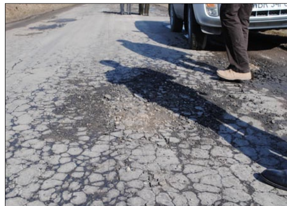
Droga jest splekana na całej długości. Przebudowa jest konieczna.

Całość zadania zrealizowana będzie w bieżącym roku. Samorząd Gminy Promna zabezpieczył na ten cel 250 tys. zł.