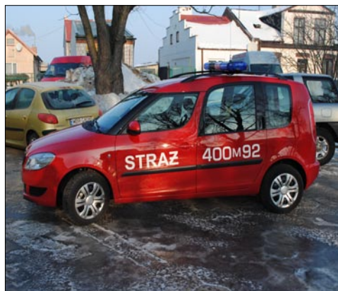
Nowy samochód poprawi bezpieczeństwo w powiecie.

Środki na zakup samochodu pozyskano z: Urzędu Gminy w Starej Błotnicy w wysokości 10.000 zł, Komendy Głównej Państwowej Straży Pożarnej 17.750 zł oraz dotacji Wojewódzkiego Funduszu Ochrony Środowiska i Gospodarki Wodnej w wysokości 27.750 zł.