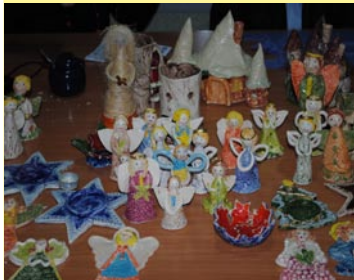
Przed świętami Bożego Narodzenia odbył się kiermasz świąteczny przygotowany przez Warsztaty Terapii Zajęciowej "Olszynka".