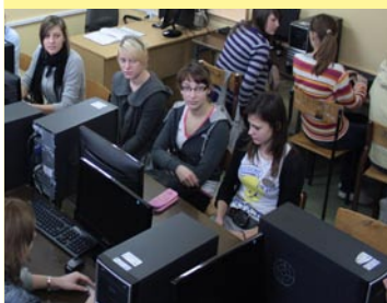
W ZSP powstała nowa pracownia do grafiki komputerowej w ramach projektu „Dobra Szkoła - Blisko Domu”. Wartość 48 tys. zł.