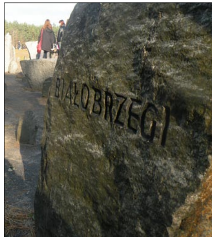
Kamień poświęcony pomordowanym z Białobrzegów

Nazwa obozu pochodzi od niewielkiej stacji kolejowej Treblinka niedaleko wsi Poniatowo. Treblinka jest jednym z największych cmentarzy Europy. Według badań historyków w Treblince Niemcy wymordowali około 900 tys. mieszkańców miast z terenu Polski, głównie narodowości żydowskiej.