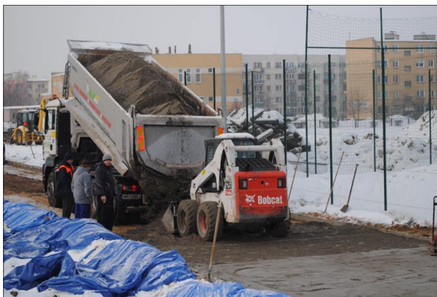
Bieżnia będzie jednym z elementów kompleksu sportowego przy Zespole Szkół Ponadgimnazjalnych.

Głównym wykonawcą inwestycji jest firma „Kaszub” z Kiełpina - Leszno.