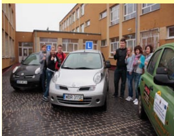
Uczniowie klas technikum agrobiznesu w ZSP bezpłatnie mogą odbyć kursy prawa jazdy w ramach programu „Dobra Szkoła - Blisko Domu”.