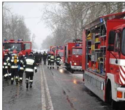
W akcji brało udział 15 wozów strażackich.

W akcji zaplanowany był również udział śmigłowca lotniczego pogotowia ratunkowego, lecz trudne warunki uniemożliwiły jego użycie. W ćwiczeniu udział brało dziewięć radiowozów i 58