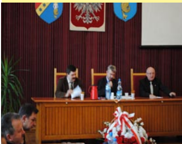
Budżet na 2011 r. Rada Powiatu Białobrzegiego uchwaliała jednogłośnie.