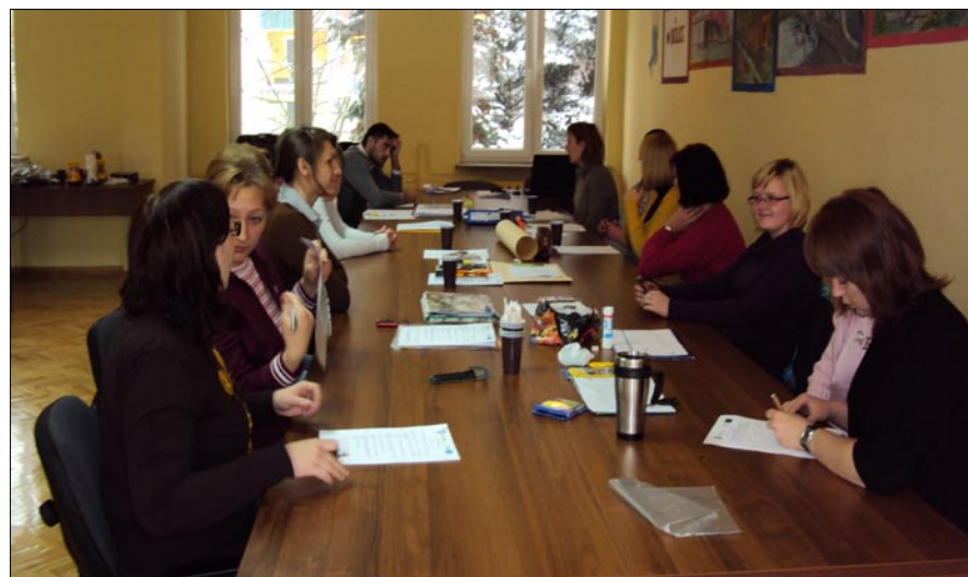
Szkolenia animatorów to ważny element programu.