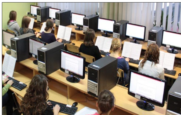
Projekt zakłada m. in. unowocześnienie bazy dydaktycznej w ZSP.