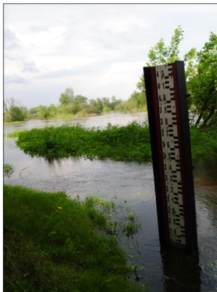
Stan wody w Pilicy determinuje sytuację powodziową w całym powiecie.

popowodziowych: Warka - Kępa Niemojewska - Biała Góra, Bukówno