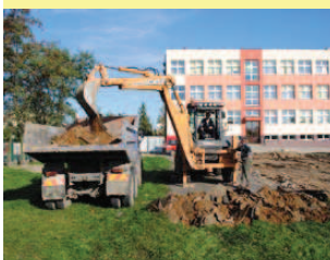
Rozpoczynają się prace przy budowie hali sportowej. Generalnym wykonawcą jest Dorbód S.A. z Kielc.