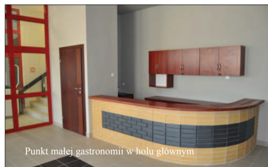
Punkt małej gastronomii w holu głównym