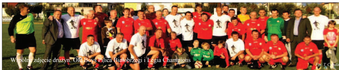
Wspólne zdjęcie drużyn: Old Boys Pilica Białobrzegi i Legia Champions

Nazakończenie obchodów jubileuszu drużyna Pilicy, złożona głównie z zawodników reprezentujących nasz klub w przeszłości zagrała pokazowy mecz z drużyną Legia Champions. Wszystkim działaczom, piłkarzom i sympatom klubu życzymy kolejnych lat sukcesów sportowych!