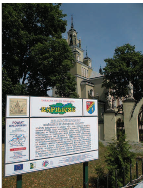
Tablice informacyjne stanęły przy atrakcyjnych obiektach.

Powiat białobrzęski pod względem atrakcyjności turystycznej jest terenem mającym potencjalne możliwości dobrego rozwoju. Bez wątplenia jednym z elementów przyciągających turystów są zabytki architektury oraz ciekawa historia wielu miejscowości z terenu naszego powiatu. Problem polega jednak na tym, iż wiedza na temat zasobów turystycznych naszego powiatu jest wciąż mała, zarówno wśród mieszkańców tego terenu, jak