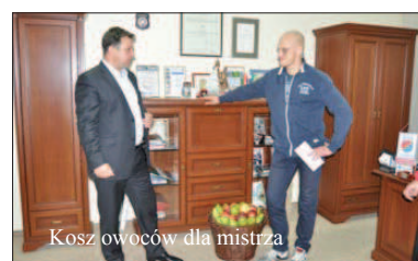
Kosz owoców dla mistrza