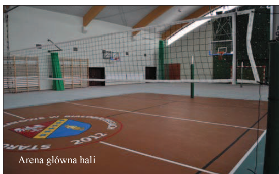
Arena główna hali