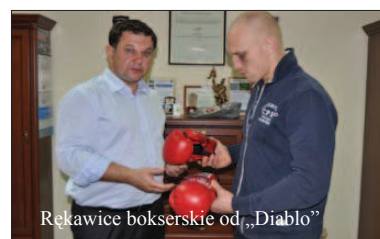
Rękawice bokserskie od „Diablo”