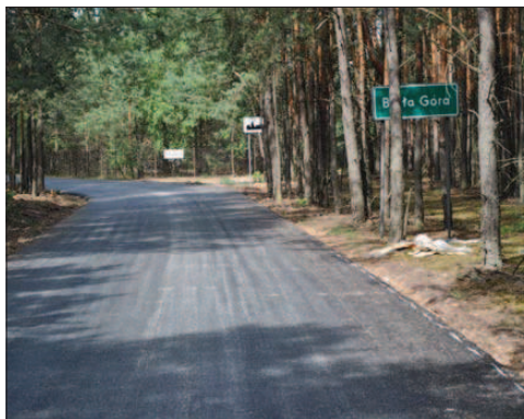
Na Białą Górę od Krzemienia dojedziemy nowym asfaltem.