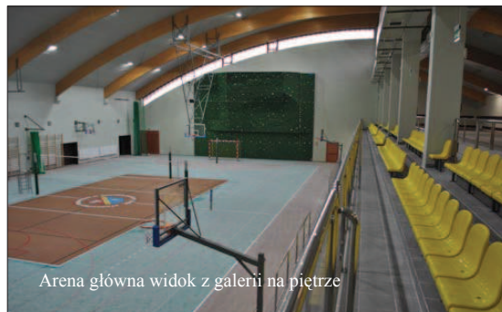
Arena główna widok z galerii na piętrze