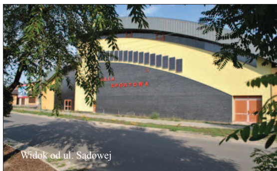
Widok od ul. Sądowej