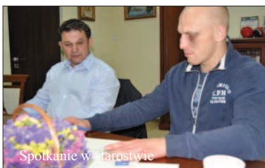
Spotkanie w starostwie