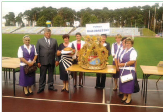
Starostowie Dożynek z Kołem Gospodyń Wiejskich z Kaszowa