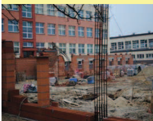
Firma Dorbud wykonuje zbrojenia ścian. Zaczynają się prace murarskie.