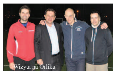
Wizyta na Orliku