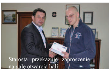
Starosta przekazuje zaproszenie na galę otwarcia hali