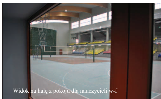
Widok na halę z pokoju dla nauczycieli w-f