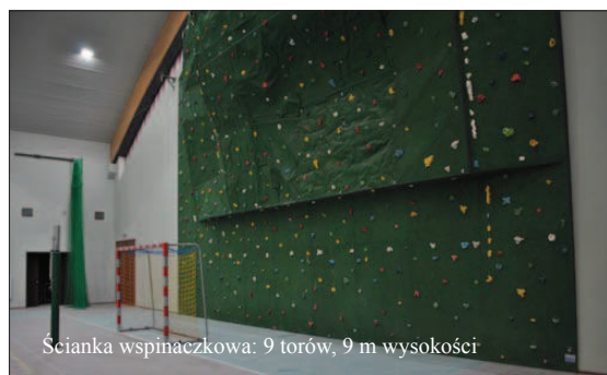
Ścianka wspinaczkowa: 9 torów, 9 m wysokości