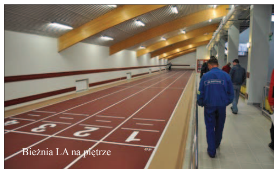
Bieżnia LA na piętrze