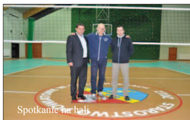
Spotkanie na hali