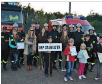
Zwycięska drużyna OSP Stawiszyn