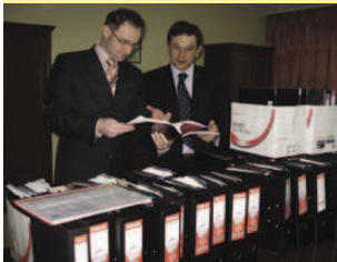
Dokumentacja projektowa dociera do Starostwa. Liczy 30 segregatorów.