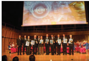
Laureacji Liderów Regionu 2012 w Radomiu.

Są szatnie z natryskami, magazyn sprzętu sportowego i pomieszczenia