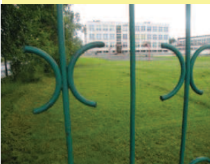
Miejsce, w którym wybudowana zostanie hala - boisko przy Publicznym Gimnazjum w Białobrzegach.