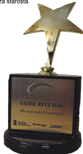
Statuetka Lidera RPO WM