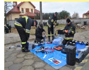
Komenda Powiatowa PSP otrzymała zestaw hydraulicznych narzędzi ratowniczych. Wartość sprzętu 103.000 zł.