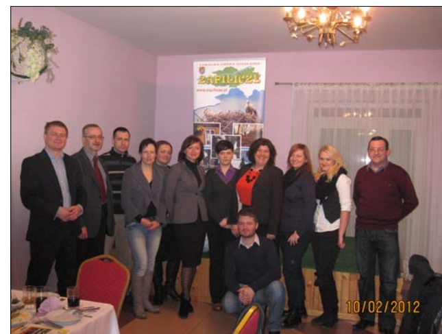
Spotkanie Zarządów LGD Zapilicze i LGD Warka w sprawie projektu współpracy

Wydawca: Starostwo Powiatowe w Białobrzegach, Plac Zygmunta Starego 9, 26-800 Białobrzegi. Opracowanie graficzne, skład - Adam Bolek. Redakcja tekstów: Piotr Kacprzak, Sławomir Bielecki, Wydziały Starostwa, Jednostki podległe. Białobrzegi, marzec 2012r.