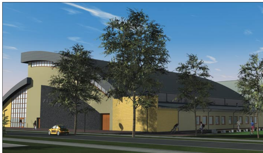
Hala przy liceum będzie gotowa w sierpniu 2012 r.

zlokalizowana będzie w budynku liceum i ogrzeje zarówno halę jak i LO. W tej sprawie podpisane zostało porozumienie, które pozwala Starostwu na przeprowadzenie przewodów ciepłowniczych przez działkę gminy ale również pozwala gminie na prace związane z przeróbką własnej sieci ciepłowniczej na działce Starostwa (Porozumienie z dnia 24.11.2011r.). Odmowa Burmistrza wpięcia się do kotłowni gimnazjum spowodowała paradoksalnie, że Burmistrz również zmusił się do przerobienia własnej instalacji ciepłowniczej, która będzie przebiegać przez działkę należącą do powiatu.