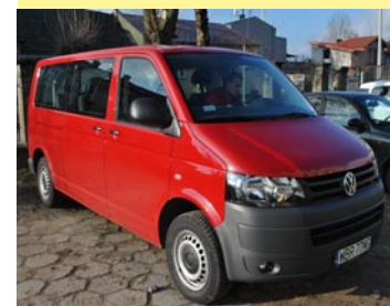
Starostwo zakupiło nowy samochód do przewozu osób niepełnosprawnych. Wartość samochodu to 144.279 zł., w połowie sfinansowana ze środków PFRON.