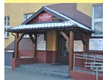
W Liceum Ogólnokształcącym powstało nowe zadanie schodów wejściowych do budynku szkoły.