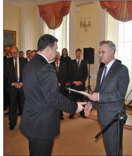
Podsekretarz Stanu w Ministerstwie Spraw Wewnętrznych Stanisław Rakoczy wręcza promesę na 1,78 mln zł Staroście Białobrzeskemu.

Wyśmierzyce 350.000 zł, Radzanów 280.000 zł, Białobrzegi 45.000 zł.