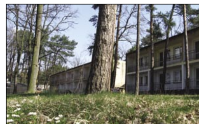
Olszynek czeka gruntowna przemiana

- Pojawił się również inny pomysł - mówi starosta Andrzej Oziębło. - Istnieją możliwości na pozyskanie prawie 1 mln zł na Zakład Aktywizacji Zawodowej o specjalizacji hotelarsko - gastronomicznej.