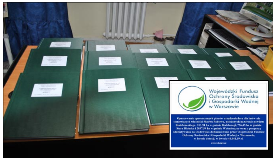
Dokument obejmuje kilkanaście segregatorów