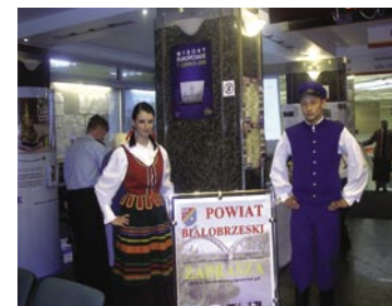
Uczestniczyliśmy w targach turystycznych w Warszawie. Stoisko powiatu białobrzegi cieszyło się dużym zainteresowaniem.