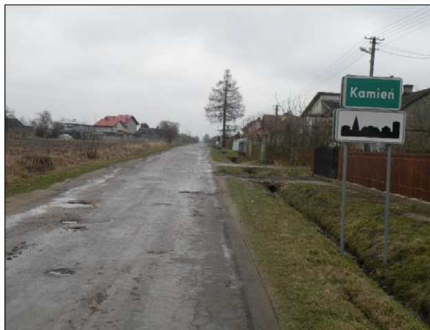
Droga w Kamieniu w tym roku będzie naprawiona.

Zakres prac obejmuje remont drogi od skrzyżowania w Suchej do nowego odcinka w Kamieniu. Zostanie uzupełniona podbudowa drogi oraz przygotowane pobocza i przepusty. Powstanie także przystanek autobusowy, umożliwiający zatrzymywanie się autobusów w Suchej na ul. Szlacheckiej. Planowane jest także ułożenie chodnika w Suchej od skrzyżowania do szkoły. Cały chodnik ułożony zostanie ze środków Starostwa Powiatowego w Białobrzegach. Przetarg rozstrzygnięty będzie w połowie maja.