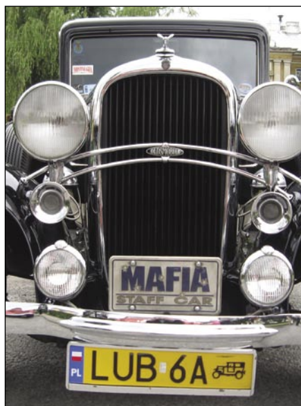
W Rajdzie wzięły udział przedwojenne samochody.

samochodów. Potem w Przybyszewie była próba techniczna i zakończenie rajdu. W wszystkich chetnych, chcących podziwiać zabytkowe pojazdy serdecznie zapraszamy na trasę rajdu w przyszłym roku.