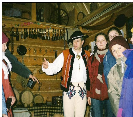
Dzięki Państwa wsparciu dzieci dobrze się bawiły na licznych wycieczkach.

Bank Spółdzielczy w Białobrzegach 38 9117 0000 0022 5878 2000 0010