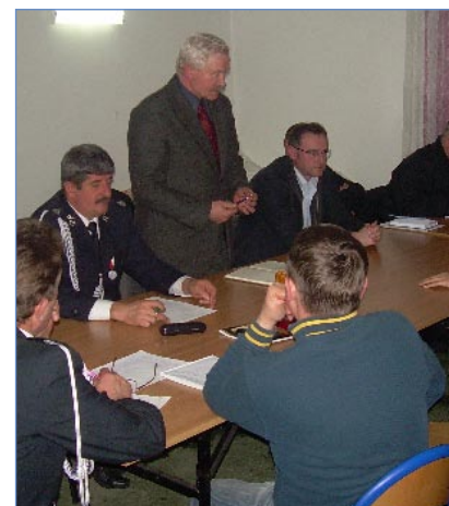
Spotkanie w Kostrzynie dotyczyło nie tylko spraw strażackich.

Na spotkaniu poruszano również problemy związane z