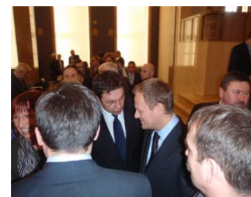
Starosta Andrzej Oziębło spotkał się w Warszawie z Premierem Donaldem Tuskiem...