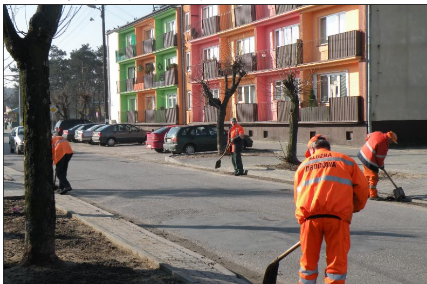
Na ul. Żeromskiego trwają prace porządkowe.

Zarząd Dróg Publicznych w Białobrzegach.