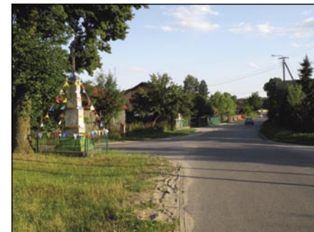
Droga powiatowa w Branicy doczeka się remontu.

gruntownej modernizacji. Planowane jest przygotowanie podbudowy, położenie dwóch warstw asfaltu, profilowanie poboczy, wykonanie zatok autobusowych oraz przejść dla pieszych. W Radzanowie ułożony zostanie chodnik z kostki brukowej. Cała inwestycja prawdopodobnie rozpocznie się jeszcze w tym roku, a zakończona zostanie w 2010.