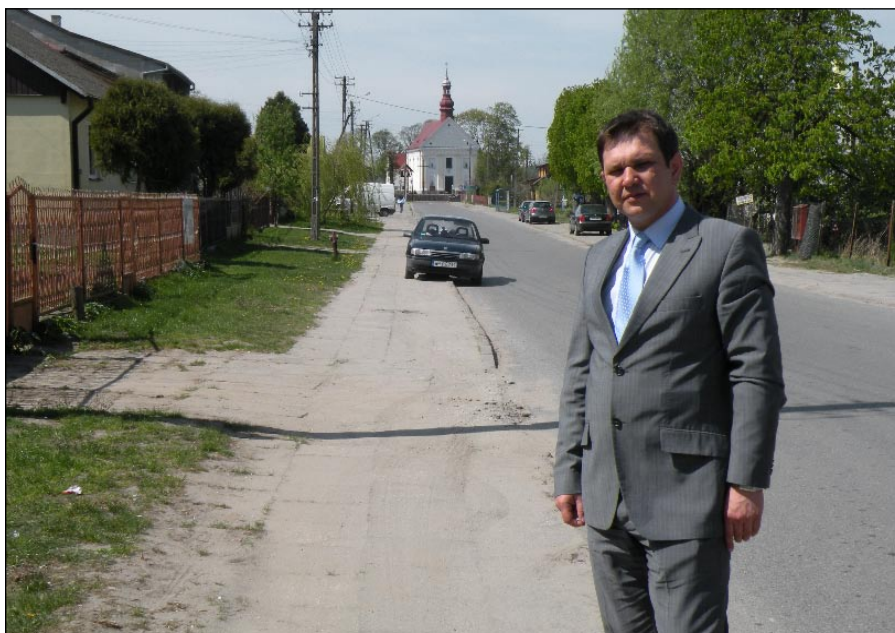
Droga powiatowa w Radzanowie będzie zmodernizowana wraz z chodnikami.