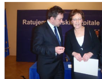
... i Panią Minister Zdrowia Ewą Kopacz. Oboje przyjęli zaproszenie do odwiedzenia Powiatu Białobrzegi.