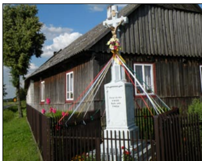
XIX-wieczna kapliczka w Kaszowie.