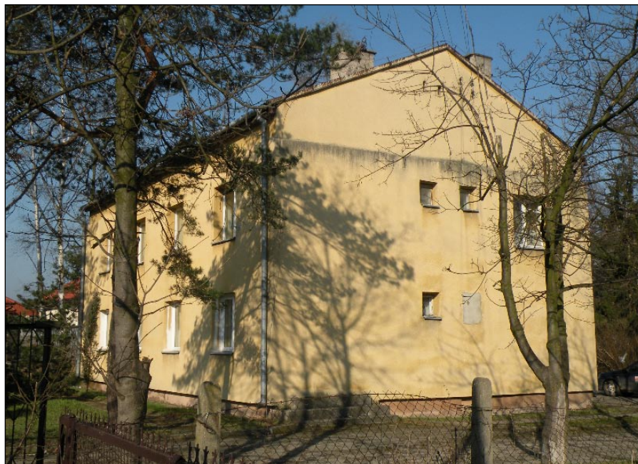
Budynek po Paradni Psychologiczno-Pedagogicznej na ul. Rzemieślniczej zostanie sprzedany.

30 kwietnia na XXVI Sesji Rady Powiatu Białobrzskiego Zarząd Powiatu otrzymał jednogłośnie absolutorium za wykonanie budżetu w 2008r.