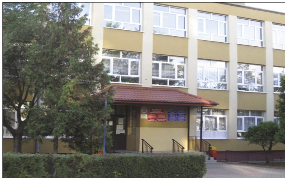
Zajęcia dla Dorosłych odbywają się w Zespole Szkół Ponadgimnazjalnych przy ul. Żeromskiego 86.

Szkoły oferują również kursy zawodowe, językowe i komputerowe. Wszystko to jest szansą dla ludzi dorosłych na uzupełnienie wykształcenia co może otworzyć nowe kierunki zdobycia pracy lub pozwolić na dalsze kształcenie na wyższych uczelniach. Nauka w szkołach TWP dla Dorosłych jest także atrakcyjnym sposobem na zdobycie wiedzy, zawodu i pomocą w poszukiwaniach na rynku pracy dodatkowych kwalifikacji. Zajęcia w szkole odbywają się w systemie sobotnio-niedzielnym.