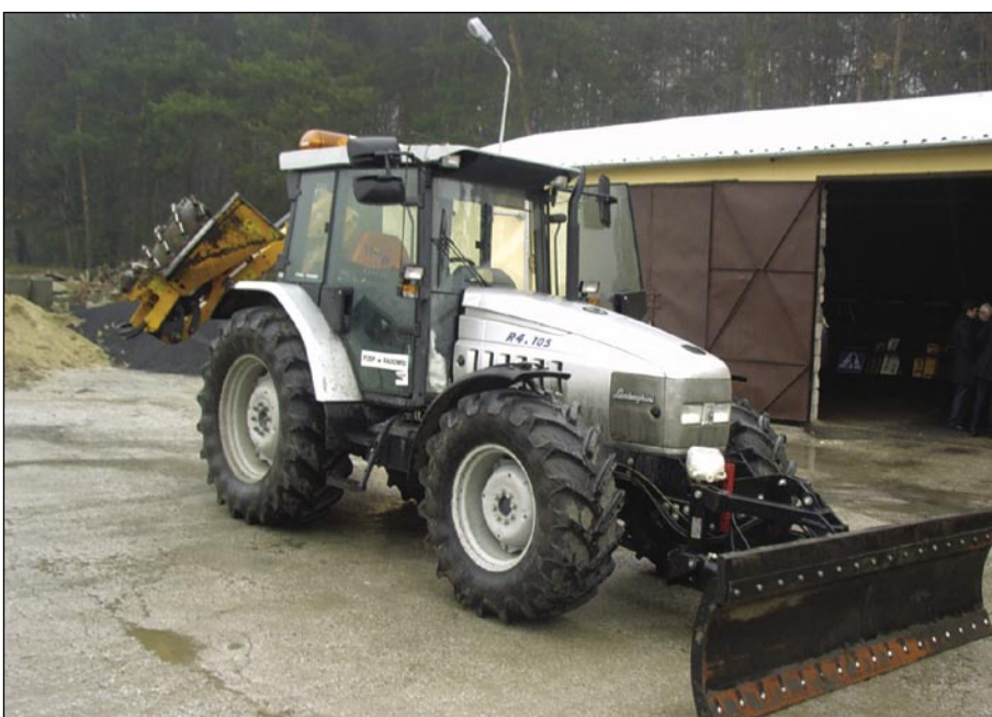
Ciągnik uporządkuje drogi powiatowe i gminne.

Zakupiliśmy samochód ciężarowy z HDS-em dla Powiatowego Zarządu Dróg Publicznych w Białobrzegach.