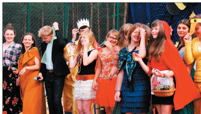
Występy dzieci i młodzieży ubarwiły festyn w Wyśmierzycach.

Po takich emocjach duża część naszych gości zechciała dopingować piłkarzy – gimnazjalistów i piłkarzy – rodziców w meczu futbolowym sędziowanym przez dyrektora gimnazjum