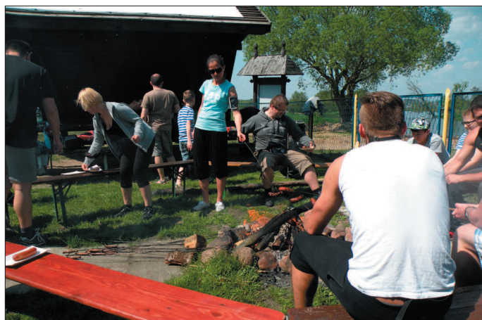
Stacja wodna w Białobrzegach jest doskonałym miejscem do odpoczynku.

Oprócz tego powinniśmy pamiętać, że należy pływać w kamizelce asekuracyjnej, która zwiększa bezpieczeństwo osób niepewnie czujących się na wodzie. Dzieci kamizelkę powinny zakładać obowiązkowo. Telefony komórkowe i dokumenty chowajmy do wodoodpornych opakowań. Śmieci nie zostawiamy, tylko zbierzmy do worka, po zakończeniu spływu zostawimy je w miejscu do tego wyznaczonym. Zmora niektórych początkujących kajakarzy są odciski na dłoniach. Pamiętajmy, że powstają one na dłoniach suchych i rozgrzanych, dlatego należy je często zanurzać w wodzie lub trzeba założyć rękawiczki (np. rowerowe).