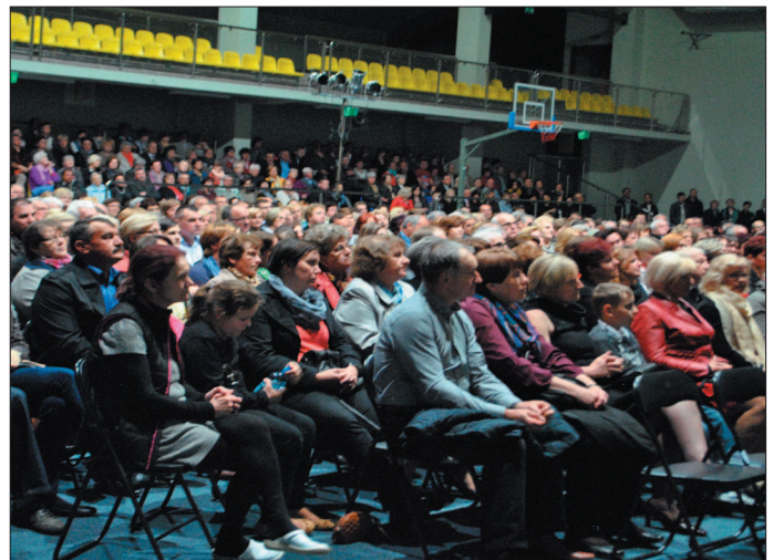
Spektakl obejrzało ponad 700 mieszkańców powiatu.