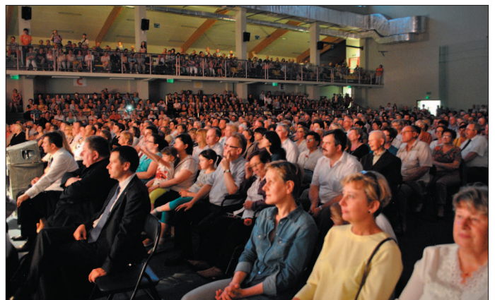
Występ na żywo zobaczyło ponad 1700 mieszkańców powiatu.