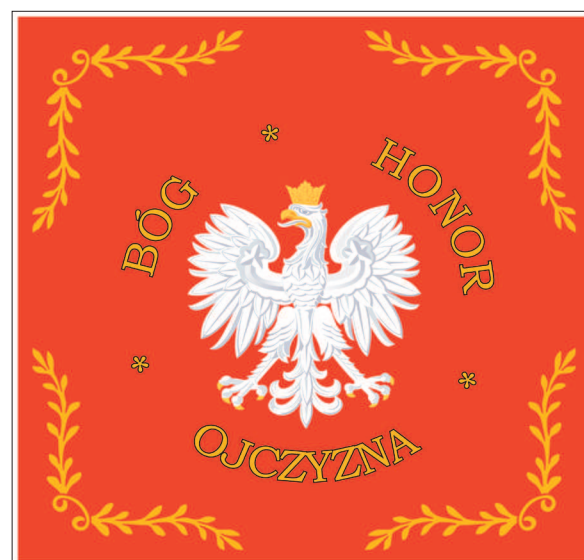
Projekt rewersu sztandaru.