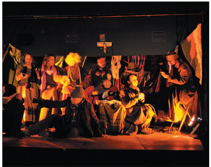
Na scenie wystąpiło 18 aktorów z różnych teatrów krakowskich. Na potrzeby tej sztuki założyli Stowarzyszenie Scena Moliere.

Na zaproszenie starosty Andrzeja Oziębło, ks. proboszcza parafii Białobrzegi oraz proboszczów parafii z terenu powiatu białobrzeskiego spektakl zobaczyło ponad 700 mieszkańców powiatu.