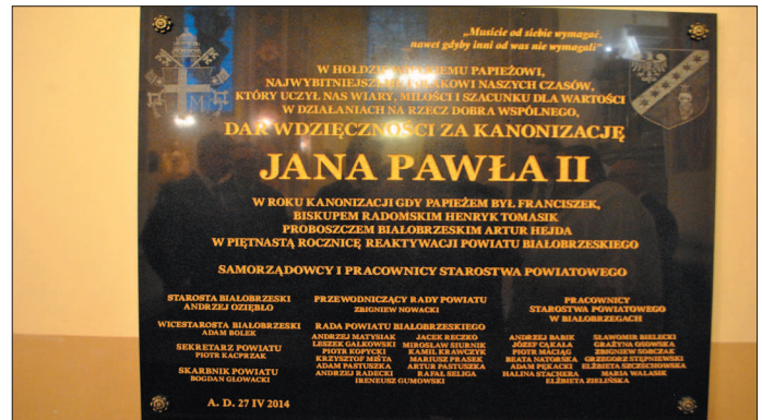
Granitowa tablica została ufundowana ze składek: kierownictwa Starostwa, radnych Rady Powiatu i pracowników.