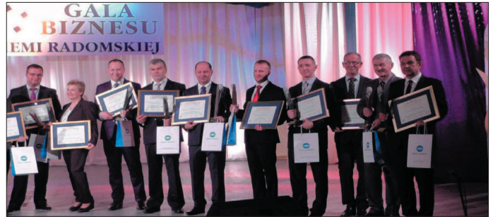
Laureaci Gali Biznesu o nagrodę Granitowego Tulipana.