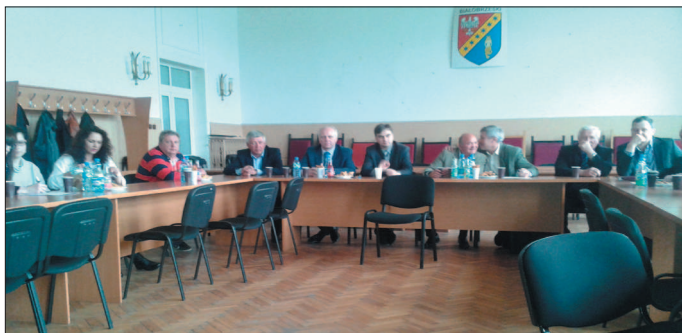
Walne zebranie członków Lokalnej Grupy Działania „Zapilicze”.