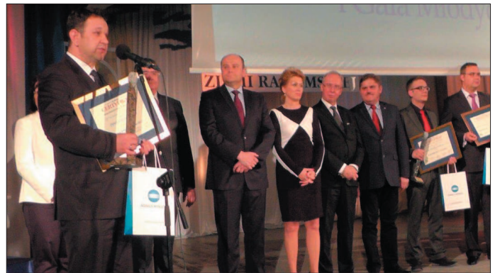
Starosta podziękował za docenienie pracy dla mieszkańców.