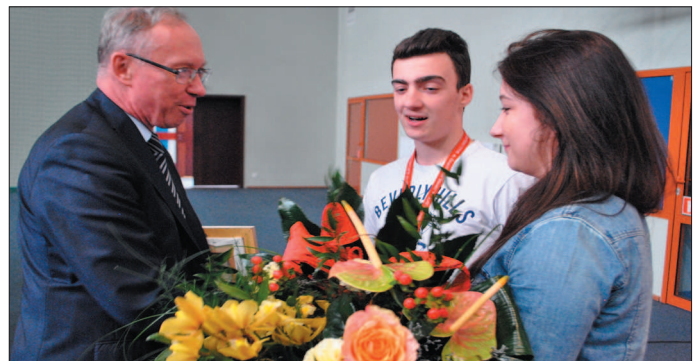
Wojewoda w podziękowaniu za spotkanie otrzymał od uczniów kwiaty.