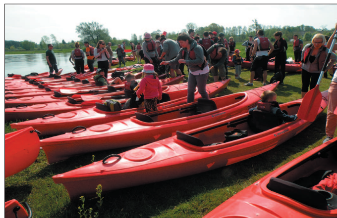
Kajaki wodujemy w miejscach wyznaczonych przez organizatorów spływu.

Całość trasy pokonamy w 6 h i 15 min, płynąc spokojnym tempem. Jest to oczywiście orientacyjny czas, tempo spływu może być różne. Pamiętajmy, że należy zarezerwować czas na odpoczynek czy zwiedzanie. Spływ taki potrwa więc znacznie dłużej.