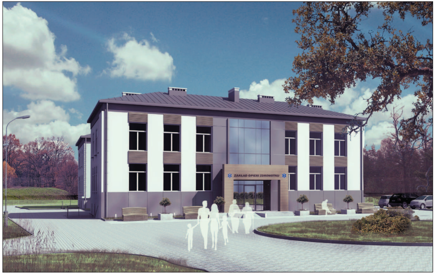
Tak będzie wyglądał budynek SPS ZOZ po kapitalnym remoncie.