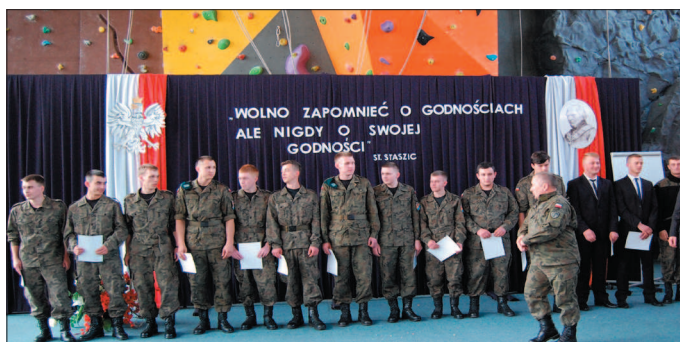
Jedna z klas logistycznych z certyfikatami ukończenia szkoły.