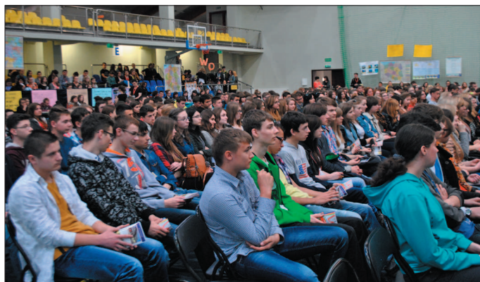
Gimnazjaliści zapoznali się z ofertą edukacyjną szkoły.

Dziękujemy raz jeszcze za okazane zainteresowanie i tak liczne przybycie do naszej szkoły. Mamy też nadzieję, że to Liceum Ogólnokształcące im. Armii Krajowej wybieriecie już niebawem na miejsce swojej dalszej edukacji.