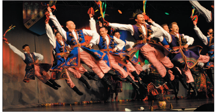
Popisy taneczne zespołu zapierały dech w piersiach.