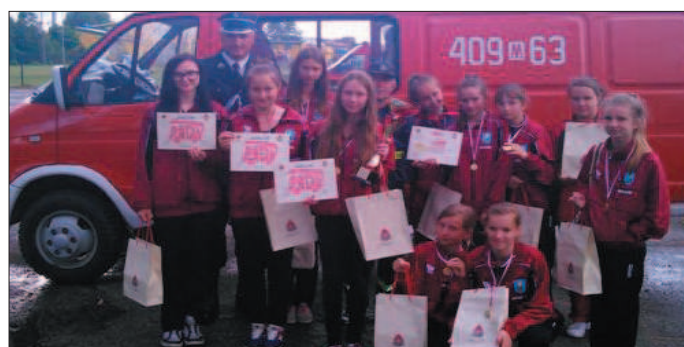
Żeńska drużyna OSP Suchoj - zwycięzca zawodów.