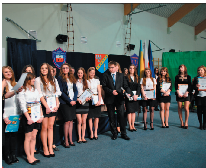
Najlepsi uczniowie LO zostali wyróżnieni nagrodami.