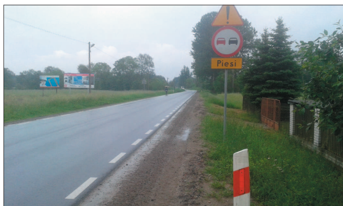
Niebezpieczny odcinek drogi krajowej na Borkach.

Jednocześnie GDDKiA w Warszawie oraz Urząd Miasta i Gminy w Białobrzegach zaakceptowały koncepcję budowy chodnika na odcinku Białobrzegi-Borki, przedstawioną przez Starostwo.