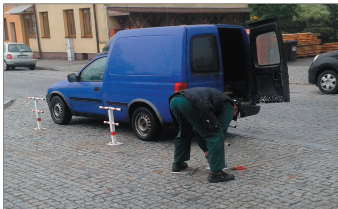
Zgodnie z wyrokiem burmistrz musiał usunąć blokady przed Ratuszem.

Powołując się na wyrok sądu w dniu 26 maja burmistrz przestał projekt zmiany organizacji ruchu na placu. Niestety w projekcie