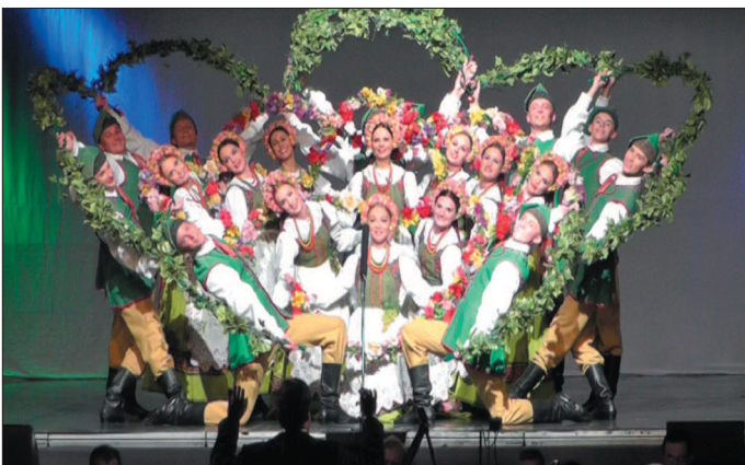
To co wyróżnia Zespół „Mazowsze” to piękna choreografia.