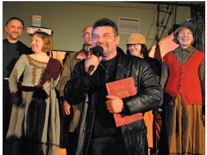
Aktorzy i reżyser podziękowali publiczności i organizatorom za miłe przyjęcie.