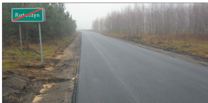
Wyremontowany ze środków powodziowych odcinek drogi powiatowej Ratoszyn - Podlesie.