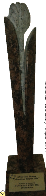
Statuetka "Granitowy Tulipan 2014"

STAROSTWO POWIATOWE W BIAŁOBRZEGACH LAUREATEM NAGRODY