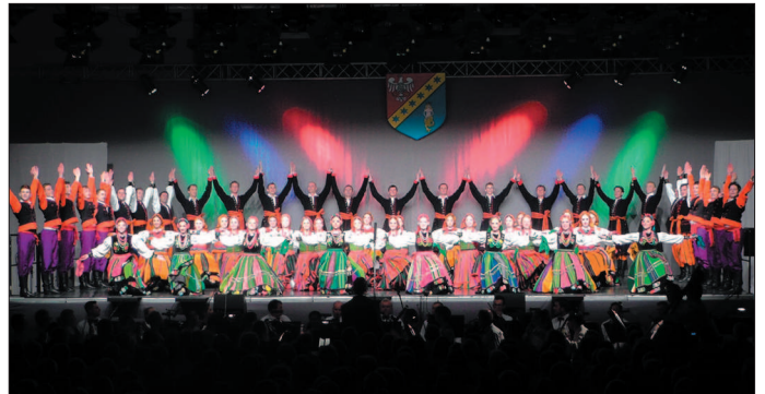
Zespół „Mazowsze” w pełnej krasie.