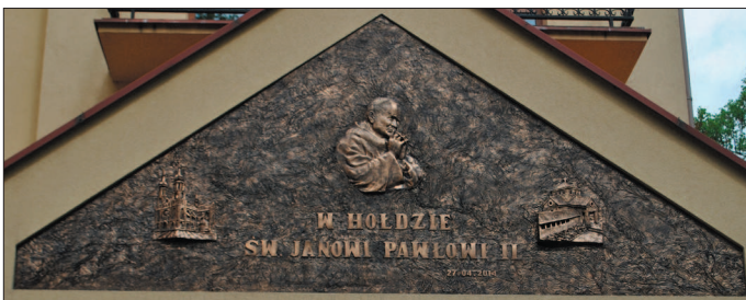
Tympanon ku czci papieża Polaka nad głównym wejściem do budynku ośrodka.