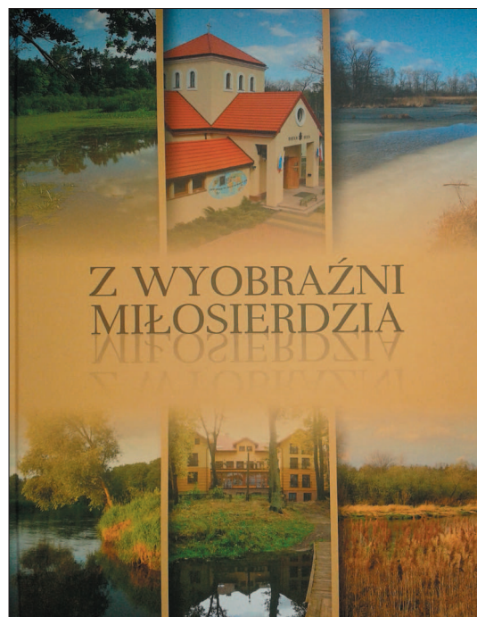
Okładka książki-albumu o Ośrodku Emaus.