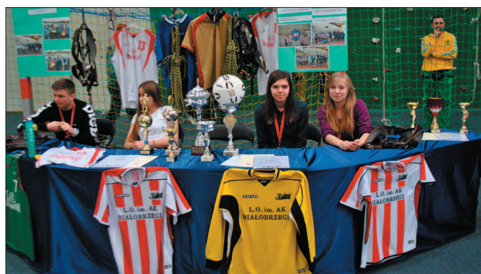
lo Jedno ze stoisk, prezentujące osiągnięcia sportowe LO.