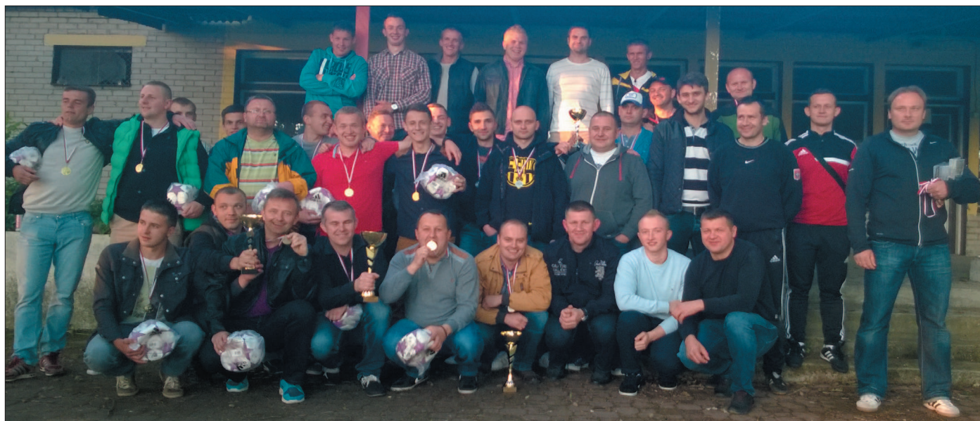
Najlepsze drużyny czwartej edycji Powiatowej Ligi Piłki Nożnej Orlik Liga 2013/2014.

Wydawca: Powiat Białobrzegi. Plac Zygmunta Starego 9, 26-800 Białobrzegi. Redakcja tekstów: wydziały i jednostki organizacyjne. Redaktor naczelny Sławomir Bielecki (s.bielecki@bialobrzegipowiat.pl). Zapraszamy do współpracy. Czerwiec 2014. Materiały do następnego numeru prosimy dostarczyć do 30 sierpnia 2014 r. ISSN 2300-7710.