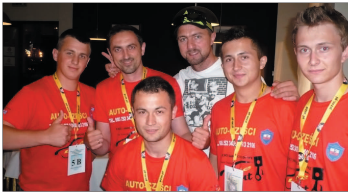
Drużyna LO w finale w Poznaniu na wspólnym zdjęciu z Jerzym Dudkiem, byłym bramkarzem reprezentacji Polski.