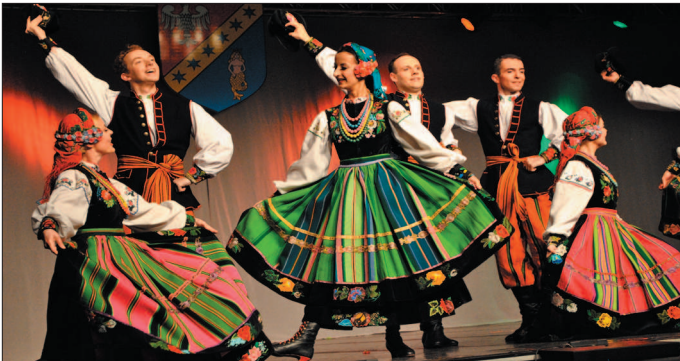
Piękne stroje ludowe i mistrzowskie wykonanie - wizytówka „Mazowsza”.