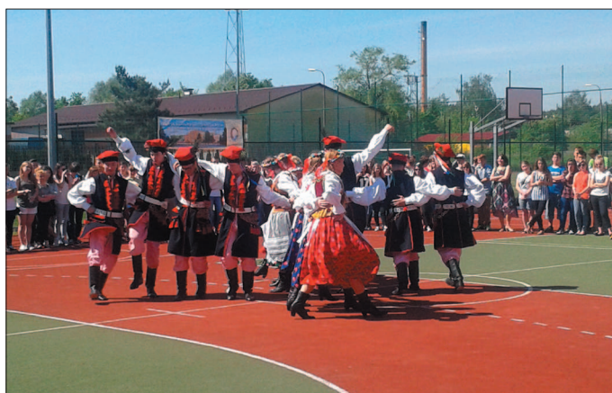
Zespół Misz-Masz zaprezentował gimnazjalistom taniec ludowy.

Podczas kolejnych prezentacji można było zobaczyć uczniów z klasy wojskowej, którzy wykonali pokaz musztry parady.