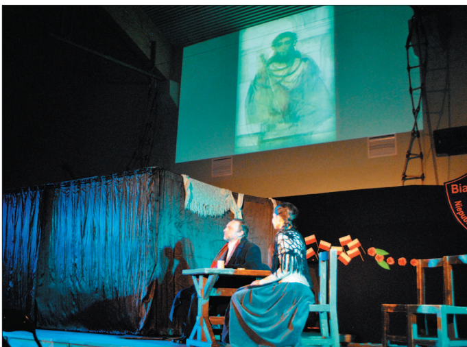
Przedstawienie teatralne wzbogacone było pokazem multimedialnym.