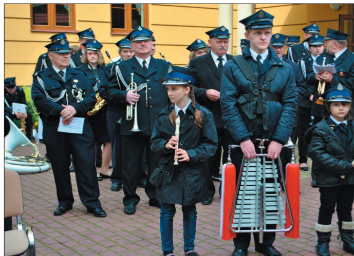
Oprawę muzyczną uroczystości zapewniła Orkiestra Strażacka z Białobrzegów.