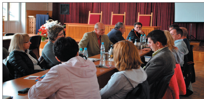
W skład Powiatowej Rady Sportu wchodzi nauczyciele wszystkich typów szkół z terenu powiatu białobrzeskiego.

Na spotkaniu omówiono realizację kalendarza Mistrzostw Powiatu dla szkół podstawowych, gimnazjalnych i ponadgimnazjalnych w różnych dyscyplinach sportowych. Sporo uwagi poświęcono organizacji tych zawodów oraz poziomowi umiejętności startujących w nich dzieci i młodzieży. Omówiono także reprezentowanie szkół powiatu w zawodach szczebla ponadpowiatowego. Ważnym punktem było ustalenie terminów oraz spraw organizacyjnych Mistrzostw Powiatu w Lekkiej Atletyce dla szkół podstawowych (16 czerwca 2014 r.), gimnazjalnych (17 czerwca 2014 r.) oraz ponadgimnazjalnych (1 października 2014 r.).