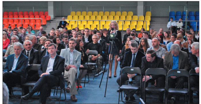
Uczestnicy debaty mogli kierować pytania do wojewody. Najwięcej z nich zadawali uczniowie naszych szkół.