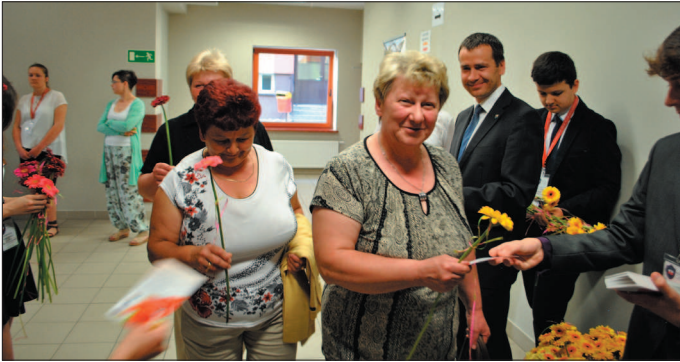
Przed koncertem wszystkie Mamy otrzymały kwiaty i życzenia.