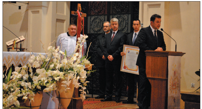
Na ręce ks. proboszcza samorządowcy i pracownicy Starostwa złożyli Akt Przekazania Tablicy Pamiątkowej.