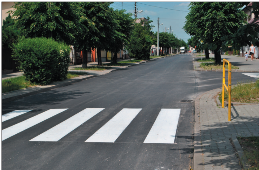
Ulica Żeromskiego w Białobrzegach została zmodernizowana i oznakowana ze środków Starostwa Powiatowego w Białobrzegach.

W zakres prac wchodzi: ułożenie dywanika asfaltowego w ciągu drogi powiatowej w miejscowości Kadłub o szerokości 5,5 m, długości 1000 m; odmulenie rowów na długości 350 m z wymianą uszkodzonych rur na 10 zjazdach do posesji