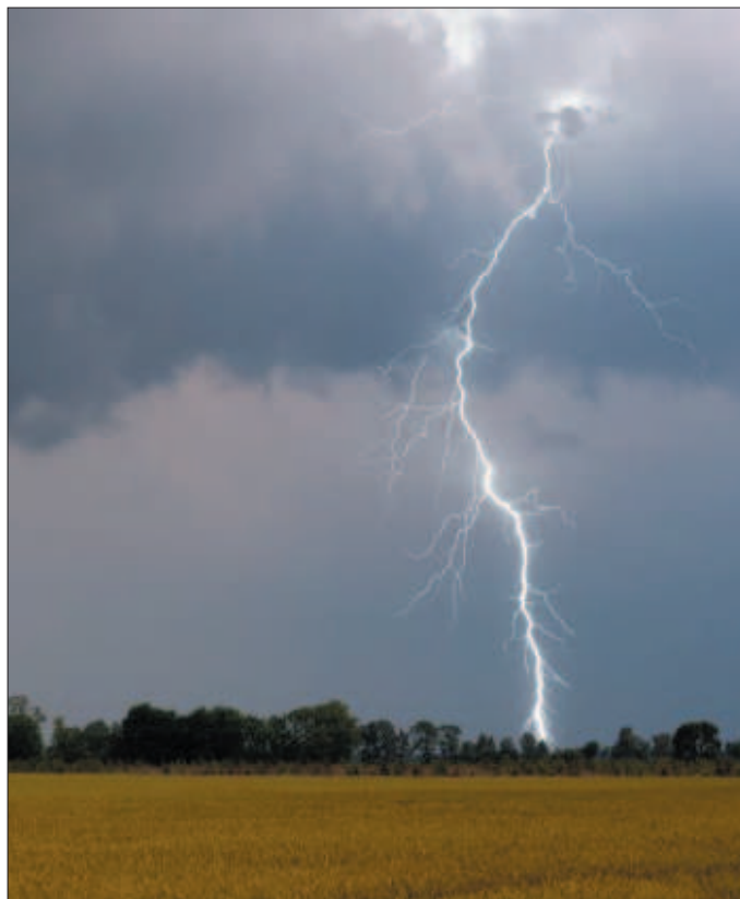
Wyładowania atmosferyczne są niebezpieczne.

3. Pamiętaj, że podczas silnego wiatru nie wolno przebywać