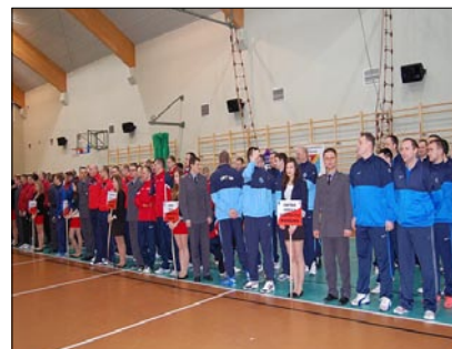
W mistrzostwach wzięło udział 10 zespołów z całej Polski.