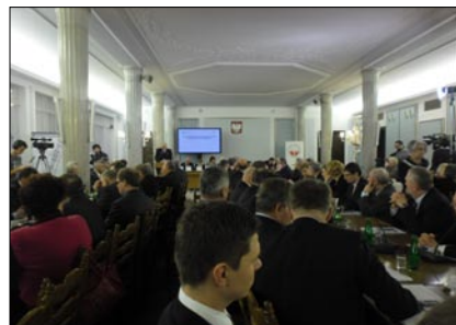
Spotkanie odbyło się w Sali Kolumnowej Sejmu RP.

Na podsumowanie były premier i szef parlamentu europejskiego powiedział do zebranych przedstawicieli samorządu powiatowego: Dobrze pracowaliście