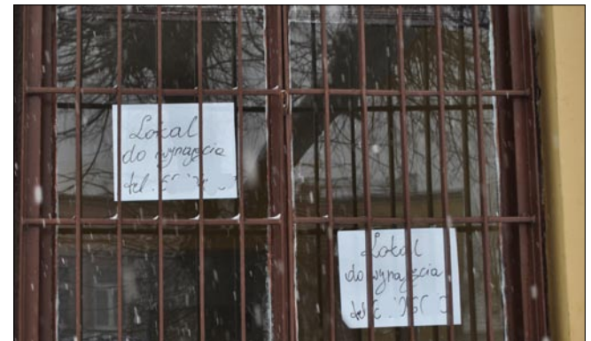
Coraz więcej sklepów w Białobrzegach jest zamykanych.