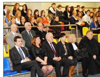
Zaproszeni goście na spektaklu.

Na deskach Teatru Szkolnego odbył się proces rehabilitacyjny Niezłomnych „Żołnierzy Wyklętych”. Nasz sąd przyznał im rację.