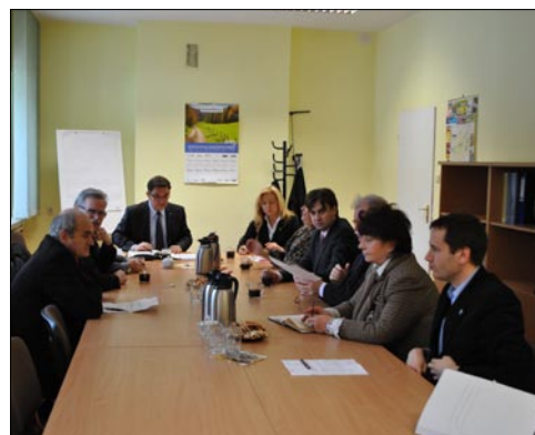
Pierwsze spotkanie Powiatowej Rady Zatrudnienia.