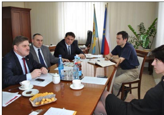
Spotkanie organizacyjne w gabinecie Starosty Białobrzeszkiego