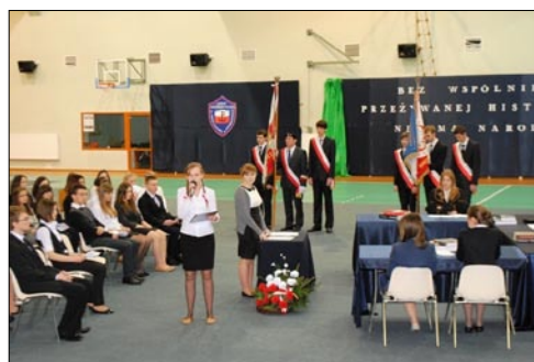
Uczniowie Liceum na deskach teatru szkolnego.

Będziesz miłował - taki tytuł nosił spektakl teatralny, który obejrzelśmy 1 marca 2013r. w Liceum Ogólnokształcącym im. Armii Krajowej w Białobrzegach wraz z zaproszonymi gośćmi: Księdzem Proboszczem Arturem Hejdą, Posłem Dariuszem