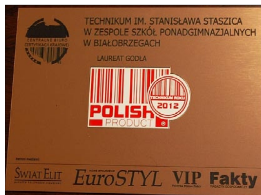
Certyfikat Technikum Roku 2012 dla ZSP