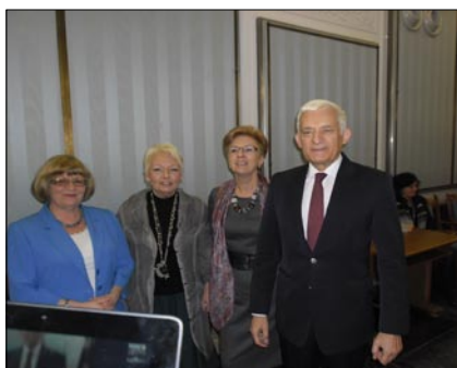
Gościem spotkania był prof. Jerzy Buzek

“Od przeszłości do przyszłości ustroju samorządu powiatowego” to tytuł konferencji sejmowej Komisji Samorządu terytorialnego i Polityki Regionalnej oraz Związku Powiatów Polskich z okazji 15 lat od usamorządowania wspólnot powiatowych, która odbyła się w Sejmie RP. Tematem konferencji było podsumowanie 15 lat istnienia